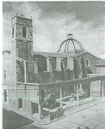
Casa de cultura

Encara que paregue mentida, el "pacte de govern" d'Ulldecona va estar a punt de trencar-se, fa poc, pels "bous" d'enguany. (Pregunteu al 1r i 3r Tinent d'Alcalde)